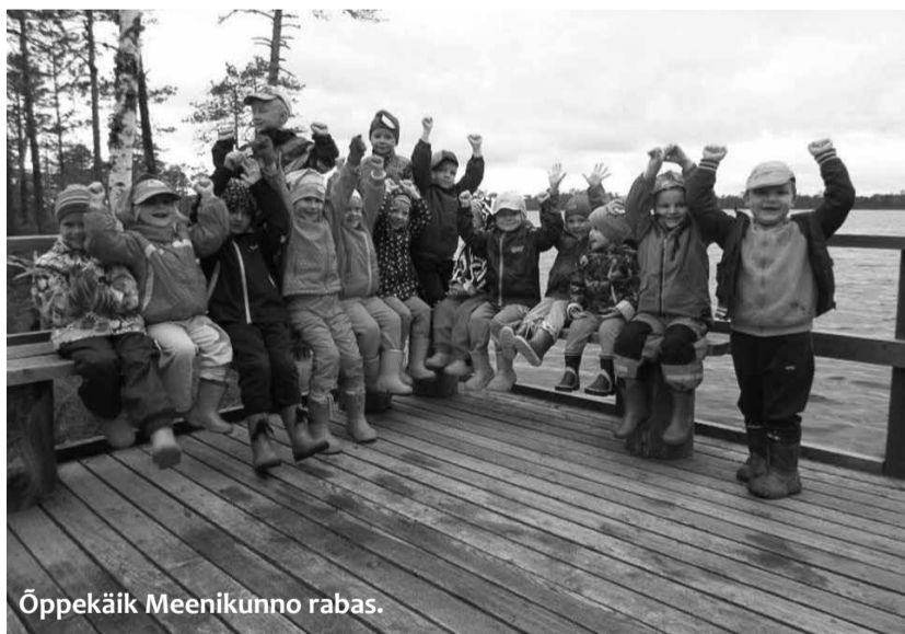
Õppekäik Meenikunno rabas.